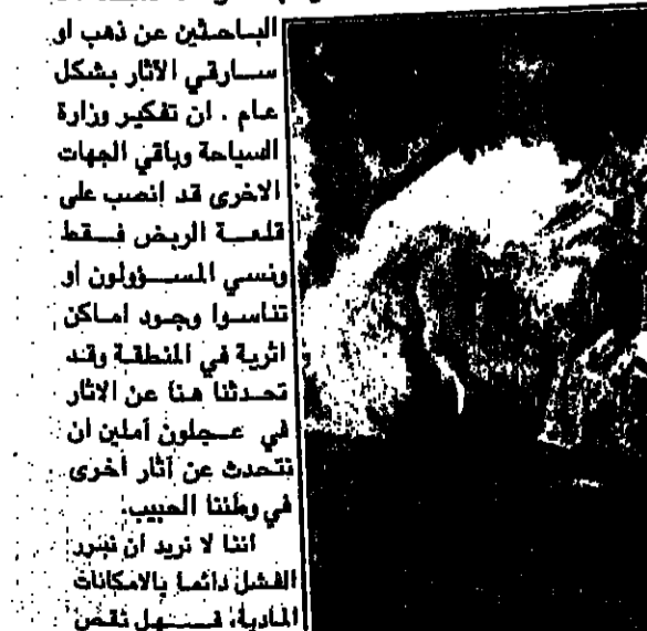
١٥ - جبال - ١٩٩٤

إننا لا نريد أن نزيد الأضلال دأماً بالامكانات المادية، فيسبل نفق الامكانيات يعني أن لا نعمل!