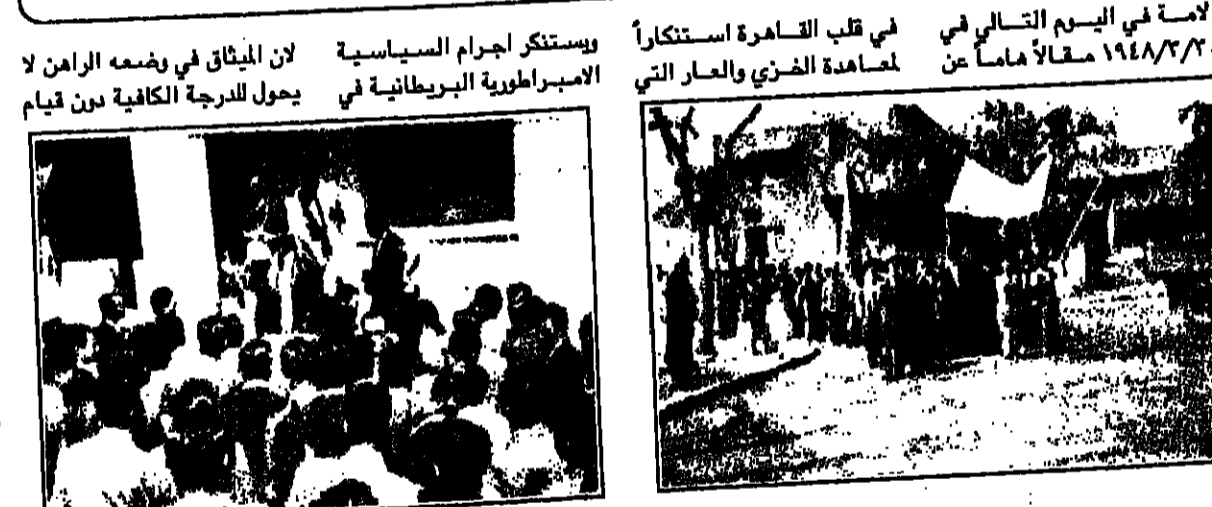
في قلب القاهرة استتكاراً لمعاهدة الفردي والعار التي

الطلاب الاردنيون في القاهرة يتظاهرون ضد معاهدة ابو الهدي - بيغن. الطلاب الاردنيون في مصر يعلنون بقوة وعزم انهم لا يعترفون بهذه المعاهدة، وأنهم سيعملون على تحطيمها. المعاهدة خطر على كيان الشعب الاردني وتحطيمه لحيته وسيادته.