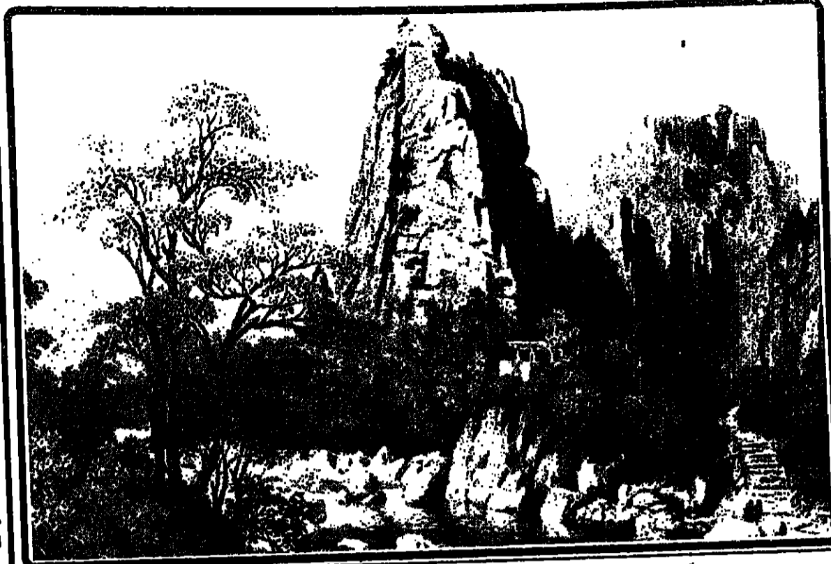
ليست كوريا بلداً من كوكب آخر، وليست اراضيها مستعمارة من بلدان العالم، ولا يختلف شعبها عن شعوب الدنيا، ولكن في كوريا ارادة بناء وتصميم عمل وقوة مبدأ، فبنت لنفسها بيتها الاخضر الصخري، وأشعبها قوة الطبقة العاملة، وعلمت على خارطة كوكبنا الارض اسماً هو "كوريا الديمقراطية".