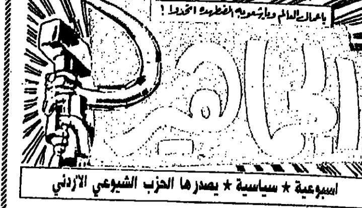
اصوبعية * سياسية * يصدرها الحزب الشيوعي الأردني